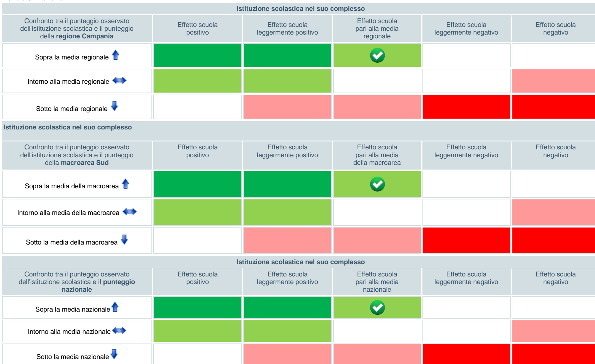
Tavola 9A Italiano